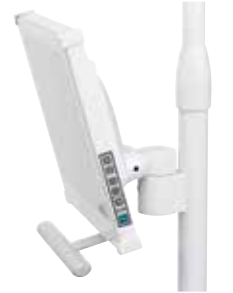
Montaje del monitor con luz