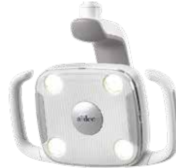
LED A-dec 300