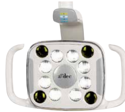
LED A-dec 500