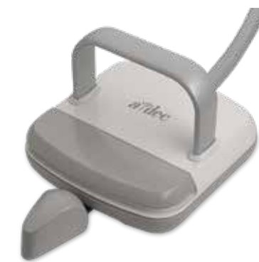
Control de pie con palanca