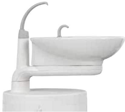
Escupidera de porcelana vidriada giratoria