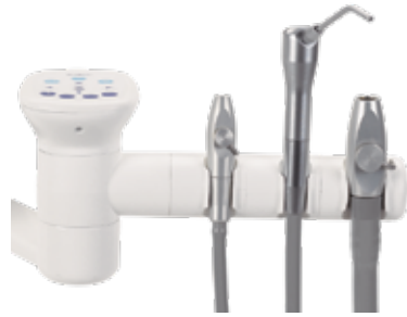
Soporte de 3 posiciones