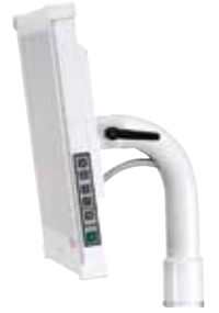
Montaje del monitor Radius