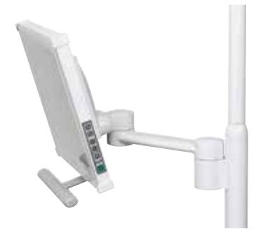
Montaje del monitor con luz con brazo de enlace