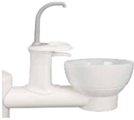
Escupidera fija de vidrio