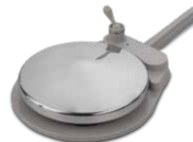
Disco del control de pie