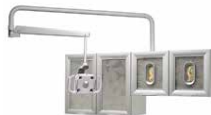
壁/キャビネットマウント