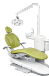
チェアーマウント