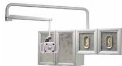
壁装式/机柜安装式